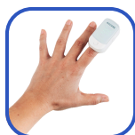
Oxymètre de pouls