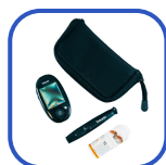
Lecteur de glycémie