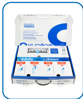
Kit d'oxygénothérapie (Pour un usage exclusif au cabinet)

Offre à durée limitée Financement accordé après validation de l'URPS IDF