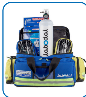
Sac d'oxygénothérapie (Pour plus de mobilité et possibilité de rangement de matériels annexes)