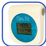
Capteur de qualité d'air